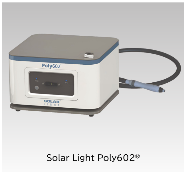
Solar Light Poly602 ®

現在SPF測定ゴールドスタンダードを提供しているグローバルリーダーとして、Solar Lightは、製品の研究、処方、および臨床試験を念頭に置き、市場で最も高速なHDRS機器を開発しました。HDRSplus ™ ソフトウェアは、臨床試験ラボ環境向けに特別に設計されており、すべてのHDRS計算を簡素化します。